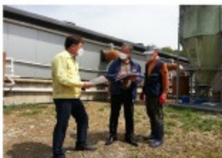
지역주민들의 지속적인 민원

농장 주변에 수많은 놀러카드가 붙고 수시로 민원 전화가 올, 정신적 고통