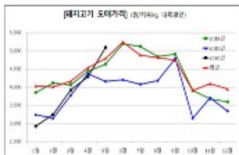
돼지고기 도매가격의 변동성과 수입 물량 증가로 가격 하락 리스크

농장 주변에 수많은 놀러카드가 붙고 수시로 민원 전화가 올, 정신적 고통