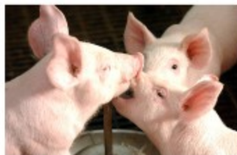
강원도 돼지고기 경쟁력 인식

계절 요인 및 외부 환경요인에 따른 돼지고기 가격 변동 리스크가 크며, 이는 양돈 경영 리스크로 작용